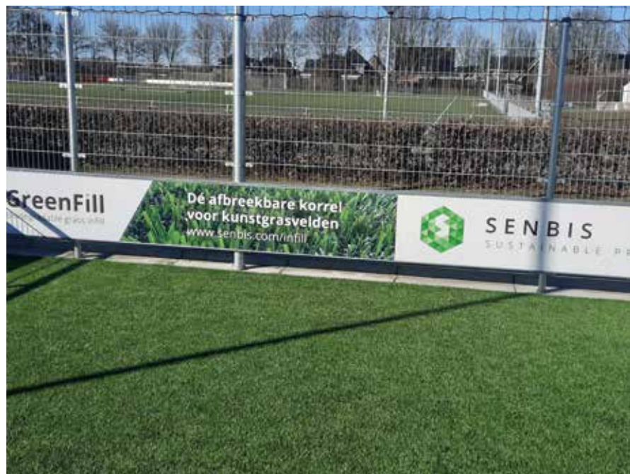
De Greenfill-korrels zijn ovaal, waardoor ze niet in elkaar haken, zoals gemalen materiaal.